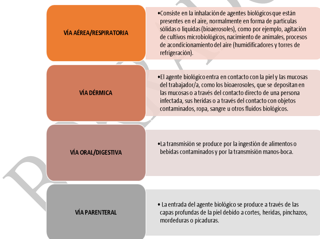
Figura 1. VIAS DE TRANSMISIÓN DEL AGENTE BIOLÓGICO