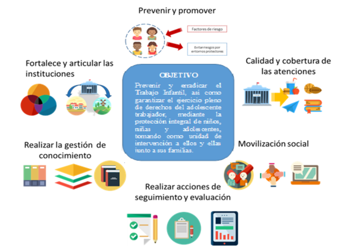
Ilustración 1. Estructuración de los ejes de la política pública identificados con base en los entornos por mejorar

Prevenir y erradicar progresivamente el trabajo infantil así como garantizar el ejercicio pleno de derechos del adolescente trabajador, mediante la protección integral de niños, niñas y adolescentes tomado como unidad de intervención a ellos y ellas junto a sus familias.